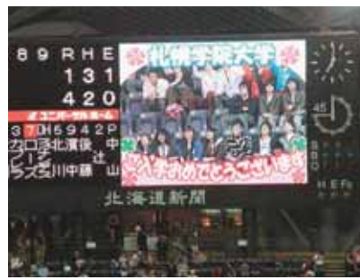
今年も北海道 日本ハムファイ ターズから招待 を受け、新入生 が札幌ドームで ナイター観戦を 楽しみました。