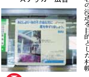
(上) JR大森駅の看板 (下) 地下鉄車内の ステッカー広告