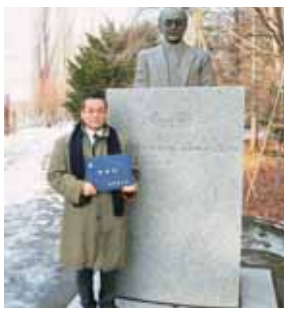
2008年、北海道大学大学院国際 広報メディア研究科博士課程 修了。新渡戸稲造像の前で

「このままではまずい」と 思い、それまでの経験をき ちんと総括し、勉強しな そうと考えました。その相 談にたまたま伺った先輩の 事務所に「地域社会マネジ メント研究科」の入学案内