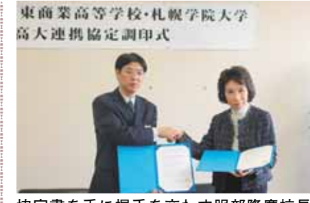
東商業高等学校・札幌学院大学 高大連携協定調印式

去る四月十日、本学と北海道札幌東商業高等学校との間で、高大連携に関する協定調印式が執り行われました。当日は、高校側から