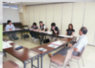
ゼミでの地域調査

論を行い、最後に調査報告書を作成します。この他に一部のゼミナールでは、地域調査や工場見学を行っています。またインターンシップでは、企業に出向いて就労体験をすることにより、企業について知ることができます。