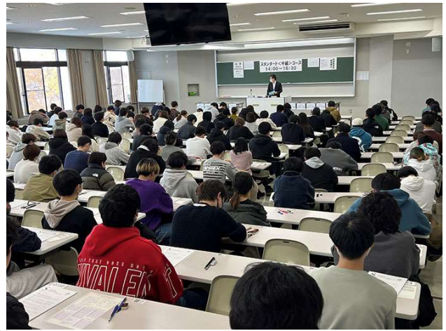
スタンダードコースの本学受験会場

法学検定試験は、公益社団法人商事法務研究会法学検定試験委員会が実施する法学全般に関するわが国唯一の検定試験で、ベーシック〈基礎〉コース、スタンダード〈中級〉コース、アドバンスト〈上級〉コースの3コースで実施されています。この試験は例年11月に全国規模（札幌市、仙台市、東京都（A地区・B地区）、愛知県、京都市、大阪府、岡山市、愛媛県、福岡市、沖縄県の11会場）で実施されます。本学では、法学部の教職員が試験実施を担うことによって、江別校舎が在学生向け団体受験会場となっています。このような体制を整えることによって受験者は年々増加傾向にあり、今年度はベーシックコース、スタンダードコースの受験者数がそれぞれ187名、165名（過去最高）でした。