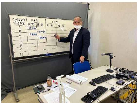
写真1 公務員対策特別演習ガイダンス

2022年度から、新カリキュラムの科目「公務員対策特別演習」がスタートしました。開講科目は2年次に5科目（公務員対策特別演習A・B・C・D・E）、3年次に4科目（公務員対策特別演習F・G・H・I）あり、充実した内容になっています。体系的に学ぶことができるように、履修に先立ち担当教員よりガイダンスを実施しています。（写真1）。