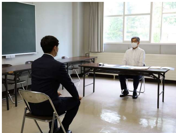
写真2 模擬面接の様子