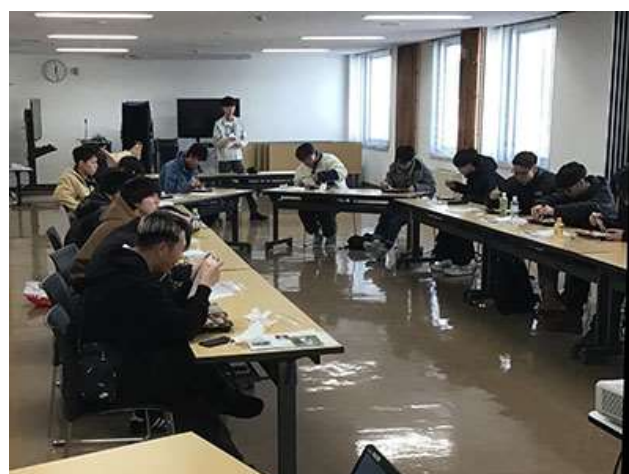
むかわ町の方々から話をうかがう